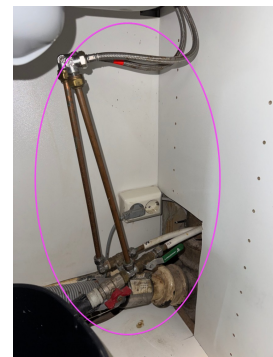
Rørene må festes/klamres bedre.