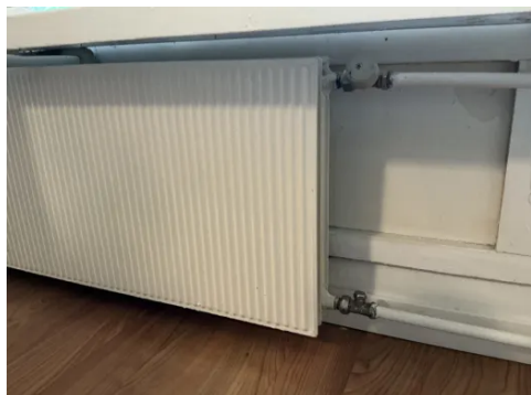
Radiator i stue.