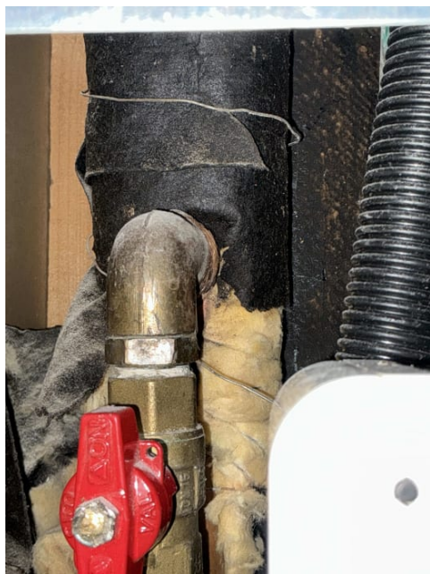
Soilrør av støpejern.