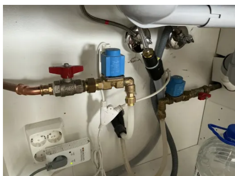
Stoppekran under kjøkkenvask.