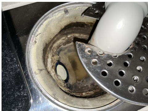
Sluk under servant.