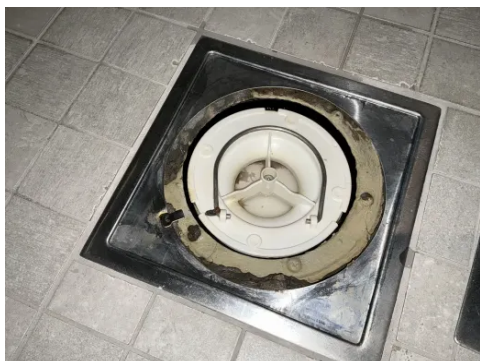
Sluk i dusjsone.