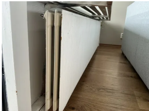
Radiator i stue.